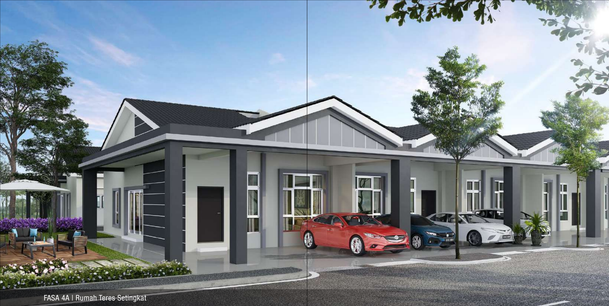
FASA 4A | Rumah Teres Setingkat